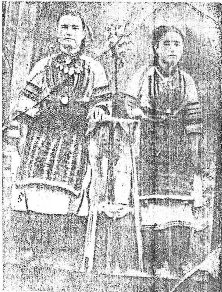
Мегленски моми въ свои народни носии.

Ву татковата ми кукия Ву таткови ми двори.