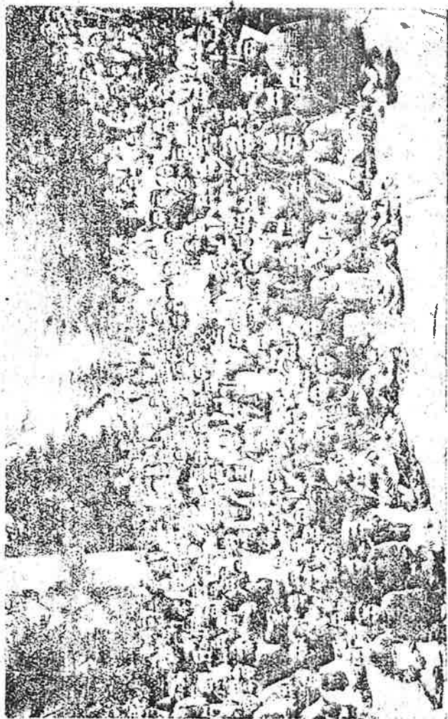
Отпразднуване Св. Св. Кирилъ и Методий въ с. Саракиново.