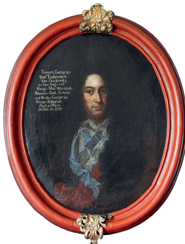
66. Portrét Tomáše Zachea Černína z Chudenic, kolem roku 1700 (zámek Manětín)

Od roku 1686 začínají zmínky o Černínově kariéře – tehdy se stal v dubnu komorníkem (patrně jedním z prvních) sotva osmiletého následníka trůnu Josefa I., což lze považovat za výborný odrazový můstek k další kariéře. 181 Od této chvíle je třeba