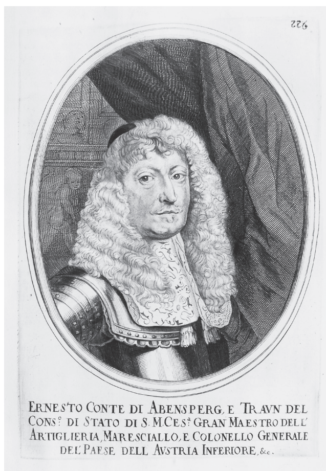
59. Ernst von Abensperg-Traun, ilustrace z knihy Galeazza Gualda Priorata Historia di Leopoldo Cesare... II, Vídeň 1670

míru významnou měrou zasloužil o reorganizaci císařské armády, jejíž jádro mělo být udrženo i pro období míru.