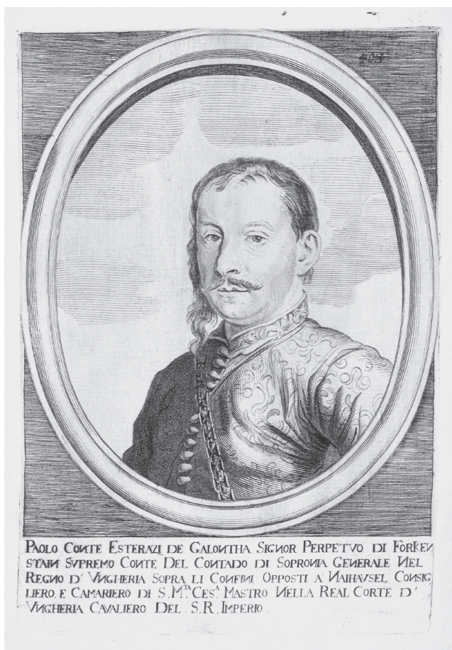
61. Pál Esterházy, ilustrace z knihy Galeazza Gualda Priorata Historia di Leopoldo Cesare... II, Vídeň 1670

Na rozdíl od výše zmíněných Pálffyů, kteří byli v první polovině 17. století mnoha manželskými svazky blízce sešvagřeni s rakouskou a českou šlechtou, tkvěl Pál Esterházy se svými početnými bratranci pevně v předivu příbuzenských vazeb uherské šlechty – i palatin Miklós, navzdory úzkým vztahům s císařským dvorem, navazování příbuzenských vztahů s cizími národy („fremde Nation“) odmítal, neboť mísení cizích mravů prý mnoho dobrého nepřináší („Mischung fremder Sitten... gar selten Gutes bringt“), a ke spříznění Esterházyů s rakouskou šlechtou tak došlo teprve v generaci Pálových dětí. 69 Pálova kariéra se, i přes některé styčné body (hodnost komorníka), ubírala cestami typickými pro uherské magnáty. Její důležitou složkou byla, zejména v mladších letech, kromě podílu na politickém životě komitátu (župy), účast při správě uherské vojenské hranice a opakující se podíl na vojenských taženích proti osmanským vojskům, tedy zkušenosti, které v případě tencallovských objednavatelů z rakouských a českých zemí vesměs postrádáme. Především jako válečník se Pál Esterházy v této době prezentoval také prostřed-