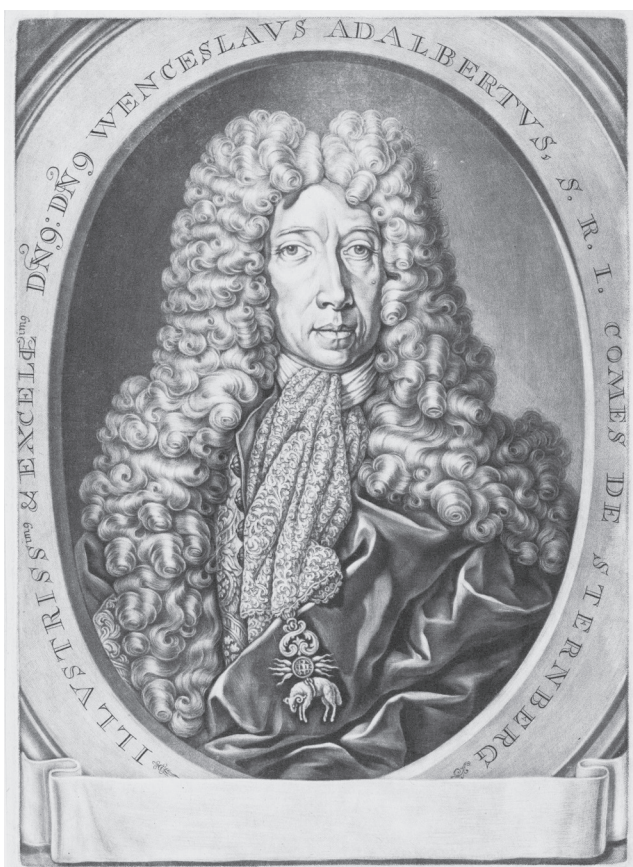
70. Portrét Václava Vojtěcha ze Šternberka, mědiryt, po roce 1699

věst, že by mohl být Šternberk jmenován nejvyšším kancléřem, zalekla se hraběnka, že jí změna ovzduší a životního stylu spojená s přesunem o Vídni přivodí smrt. 250