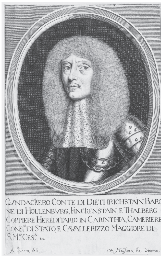
69. Abraham Bloemaert – Cornelius Meysens, Gundakar z Dietrichštejna, ilustrace z knihy Galeazza Gualda Priorata Historia di Leopoldo Cesare... II, Vídeň 1670

Souvislosti nečekaného vzestupu Gundakara z Dietrichštejna mezi nejvyšší dvorské hodnos-