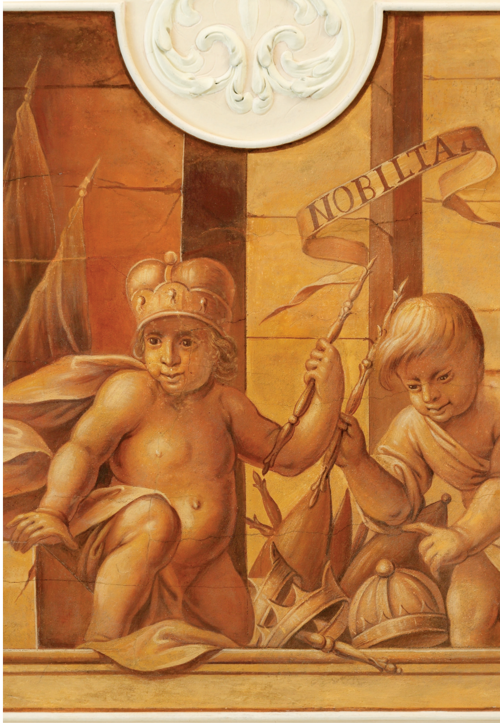
55. Giacomo Tencalla – Giuseppe Muttoni, Šlechtictví, zámek Libochovice, 1688