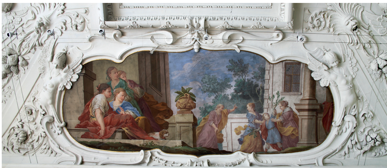
63. Carpofooro Tencalla, Harmonilova proměna v citroník , zámek Trautenfels (Štýrsko), 1670–1671

slovit konečný soud o důvodech, které jej přivedli k zaměstnání Carpofoora Tencally a k výběru ikonografického programu pro zámek Trautenfels. Zdá se nicméně, že jednou z motivací mohla být snaha reprezentovat své postavení nejvyššího úředníka ve štýrské zemské správě tváří v tvář mocenským soupeřům na domácí půdě a možná v jisté rivalitě k současně vznikající výzdobě zámku Eggenberg u Štýrského Hradce. Ve srovnání s Eggenbergem byl však zámek Trautenfels jako objekt reprezentace ve značné nevýhodě – pro společnost císařského dvora byl zřejmě vzhledem ke své odlehlosti za hranicí vnímatelnosti (na rozdíl například od Petronellu), a to zřejmě i při císařových cestách do Štýrska, ať už na poutě do Mariazell nebo do Štýrského Hradce v roce 1673. Na druhou stranu ale nelze vyloučit, že to byla právě poloha zámku, která Trauttmandorffovi umožnila získat v té době již zakázkami velmi vytíženého Tencallu do svých služeb: Trautenfels sice leží stranou cest, které spojovaly důležitá centra habsburské monarchie, nachází se však právě na spojnici mezi Vídní a Bissone. Je známo, že se Carpofooro Tencalla v zimních měsících vracel zpátky do rodné obce, a proto není nezajímavé, že jeho činnost na Trautenfelsu je doložena pokaždé na podzim. Pokud si tedy Carpofooro Tencalla kolem roku 1670 již mohl z nabízených zakázek vybírat, pak jistě měl dobrý důvod zakázku pro štýrského zemského hejtmana na jeho odlehleém zámku ochotně přijmout.