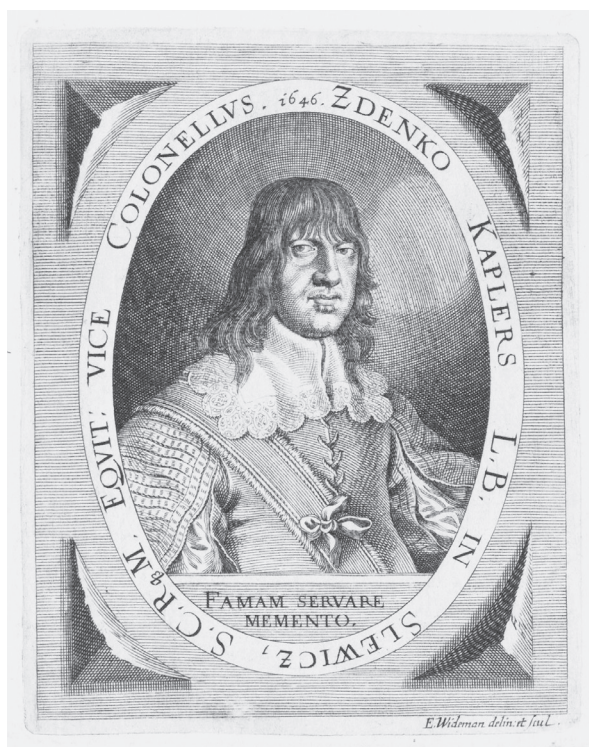
68. Elias Wiedemann, Kašpar Zdeněk Kaplíř ze Sulevic, ilustrace ze série Comitium gloriae centum... , Augsburg 1646

nanda III. (od roku 1649) jej Leopold I. po nástupu na trůn převzal mezi své komorníky. 211