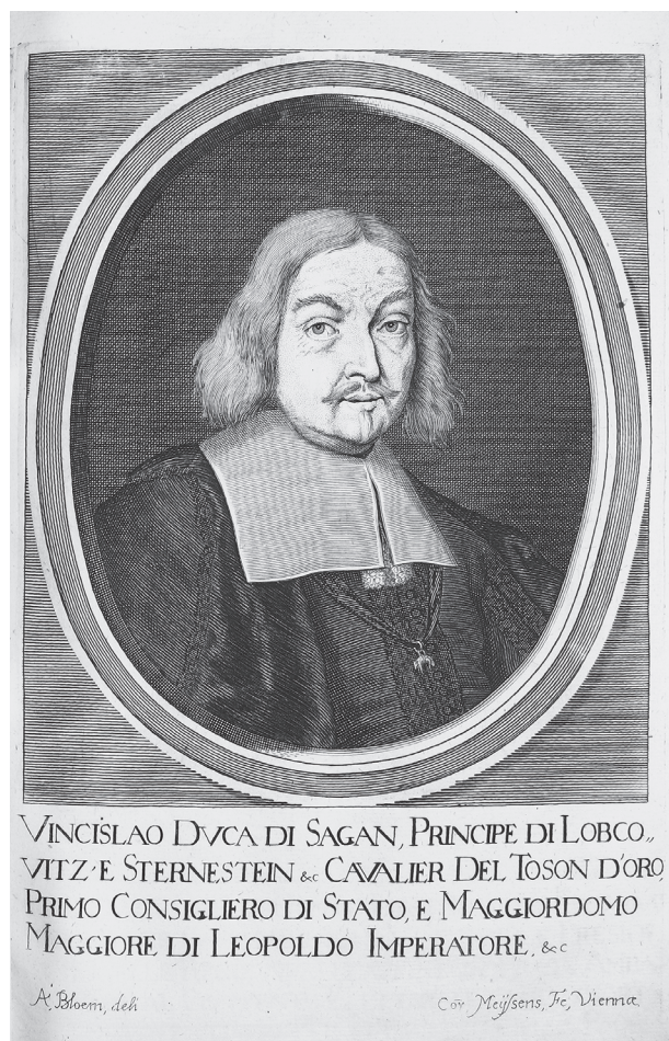
64. Abraham Bloemaert – Cornelius Meyssens, Václav Eusebius z Lobkovic, ilustrace z knihy Galeazza Gualda Priorata Historia di Leopoldo Cesare... I, Vídeň 1670

I Lobkovic patřil k ministrům, které Leopold I. zdědil po svém otci, a jejichž činnost – stejně jako jejich vzájemné rivality – výraznou měrou poznamenala začátky Leopoldovy vlády. Lobkovic si získal přízeň nového panovníka při nesnadných jednáních o Leopoldovu volbu císařem v letech 1657–1658 132 a jeho vliv zásadně vzrostl, poté co si jej císař roku 1665 vybral za svého nejvyššího hofmistra, a dále zejména po roce 1669, kdy byl od dvora vypuzen Lobkovicův rival Johann Weikhard z Auersperka a Lobkovic se na několik let sám stal dominantní postavou císařského dvora. Leopoldův vztah k Lobkovicovi však zůstával obezřetný a nejvyšší hofmistr musel záhy čelit kritice ze strany rivalizujících dvorských uskupení. Na podzim 1674 se Lobkovicovým nepřátelům podařilo přesvědčit císaře, že se nejvyšší hofmistr ve své funkci dopustil řady přehmatů. Leopold Lobkovic ze dne na den zbavil všech úřadů a vykázal od dvora na jeho sídlo