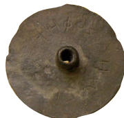
Stimmstein (psephos; Agora Athen)

Die Volksversammlung ist ein wesentliches Organ der griechischen Polis. In den homerischen Versammlungen herrscht das Prinzip der Einstimmigkeit. Im klassischen Athen entscheidet hingegen die Mehrheit; das gilt auch für das außerordentliche Verfahren des Ostrakismos, in dem geheim abgestimmt wird. Wie hat sich das Prinzip der Mehrheit durchgesetzt? Ist die Minderheit gezwungen, die Entscheidung anzunehmen oder darf sich die Minderheit von der Entscheidung lossagen? Manchmal wird allen Bürgern ein Eid auferlegt, wodurch sie gehalten werden, eine Mehrheitsentscheidung anzuerkennen.