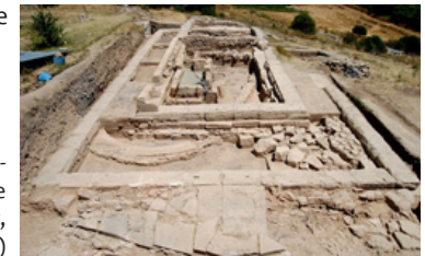
Der Südtempel mit Westgiebel in Sturzlage

Das Apollonheiligtum von Abai, eines der Nationalheiligtümer der Phoker, liegt an einer der wichtigsten Nord-Süd-Verbindungen durch Mittelgriechenland. Kern des Heiligtums bilden zwei früharchaische Tempelanlagen, deren südlicher Bau von den Persern zerstört wurde und einzigartige Befunde erbrachte. Unter dem Südtempel gibt es Belege für mindestens vier Vorgängerbauten mit Funden von Wandmalereien und wertvollen Votiven, die eine Kultkontinuität über die Früheisenzeit bis in die mykenische Epoche vermuten lassen.