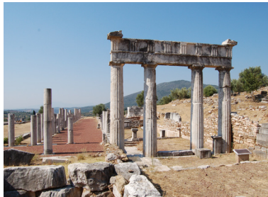
Messene, Gymnasium (P. Themelis)

Das Stadion wird an den östlichen und westlichen Längsseiten und an der nördlichen Stirnseite von den drei Stoen des Gymnasiums gerahmt. Auf Steinpfeilern und Säulen der Weststoa sind Inschriften eingetragen, welche die Epheben der Stadt nach Phylen geordnet verzeichnen. In hellenistischer Zeit wird das Gymnasium zu einem viel besuchten Zentrum des öffentlichen Lebens und zum Aufstellungsort bedeutender Kunstwerke. Es beherbergt auch zahlreiche Grabbauten in denen die Mitglieder einflussreicher Familien der städtischen Elite bestattet wurden.