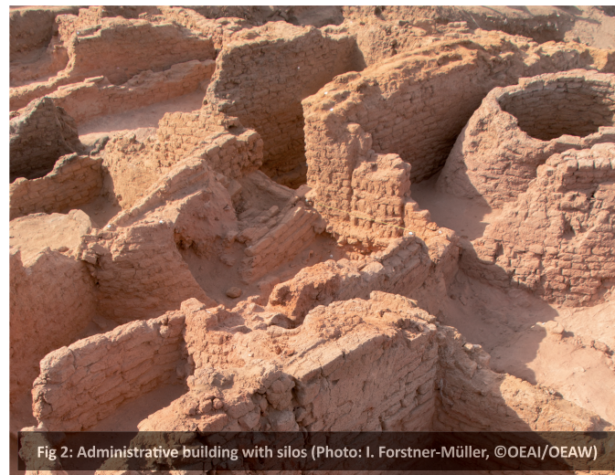
Fig 2: Administrative building with silos

The oldest so far discovered town dates to the mid-2 nd Dynasty and continues to exist at least until late First Intermediate Period/early Middle Kingdom. Epigraphic evidence for later occupation of the site (New Kingdom) is known from private tombs and temples. The site is nowadays best known for its still preserved temple built under Ptolemy VI Philometor with additions built continuously until the Roman emperor Macrinus.