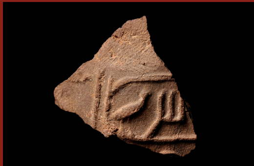
Fig 3: Seal Impression of the King Sahure, 5 th Dynasty